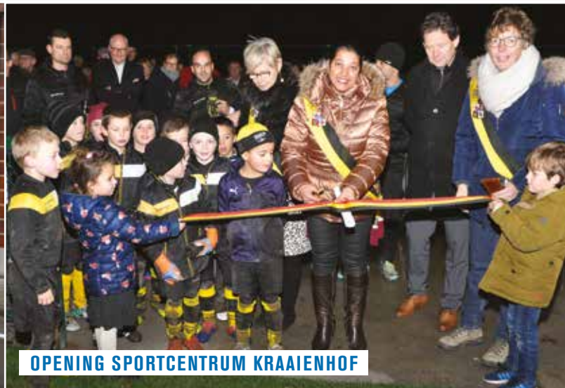
OPENING SPORTCENTRUM KRAAIENHOF